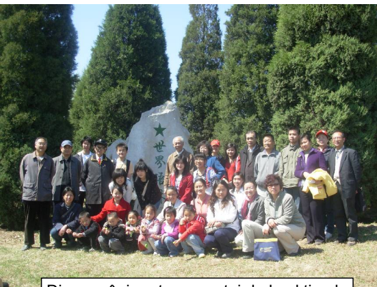
Divers-aĝaj partoprenantoj de la aktivado

La 14-an de aprilo 2007, la Pekina Esperanto-Asocio (PEA) organizas aktivadon – akvumi arbojn en Esperanto-Bosko, konstruita dum la 89-a UK en 2004. Rigardu www.youtube.com/watch?v=JtTod2gySSI por vidi filmon de la aktivado.