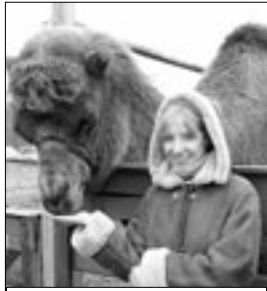
Jes, en la ukraina kamparo!