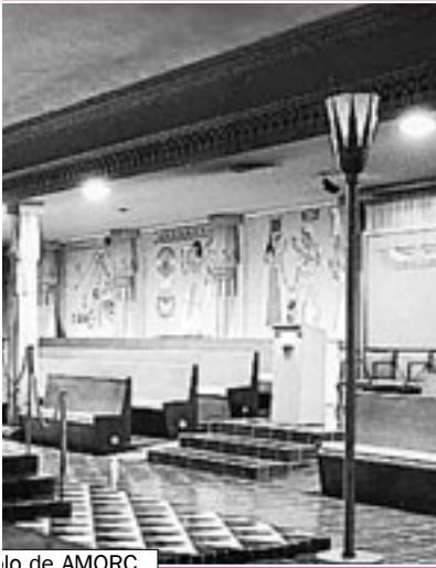
lo de AMORC

Por informoj en diversaj lingvoj vizitu < www.amorc.org >