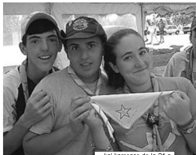
...kaj komence de la 21-a