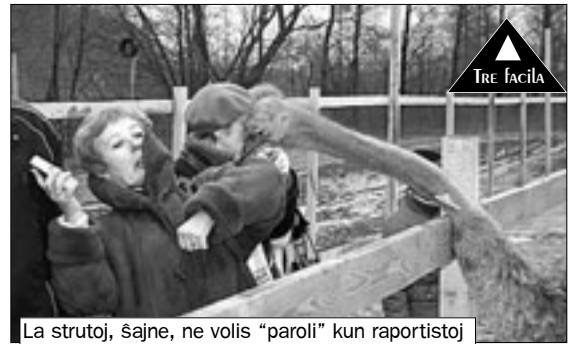
La strutoj, ŝajne, ne volis “paroli” kun raportistoj

Kiam li rimarkis, ke mi aŭskultas ĉion ĉi per tradukado de Jenja, ŝi klarigis, ke mi estas usonano. Li ŝajne estis tre feliĉa pri tiu fakto, kaj kriis : “ Vodkon al usonano!” Ver-ŝajne, usonanoj ne ofte vizitas la