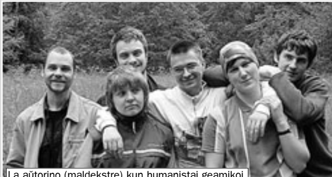
La aŭtorino (maldekstre) kun humanistaj geamikoj

Ŝajnas, ke ĉiuj konas la vorton “humanismo”. Iuj eĉ povas diri, ke ĝi aperis dum la Renesanco kaj nomi Leonardon da VINĉI-n aŭ Mikelanĝelon. Sed ne multaj scias tamen, ke humanismo estas ne nur etapo en la historio de la homaro. Ĝi formiĝis kiel movado kun propra ideologio kaj dum kelkaj jarcentoj evoluis en skolon kun diversaj direktoj kaj fluoj. En tiu ĉi artikolo mi rakontos pri la Humanisma Junulara Unio – organizaĵo, kiu aktivas en Rusio, ĉefe en Sankt-Peterburgo – kaj pri Internacia Koalicio por Humanismo. Ambaŭ tiuj organizaĵoj unuigas homojn, kiuj ne nur simpatias kaj subtenas humanismajn ideojn (kion faras multaj), sed kiuj identigas sin kiel humanistoj kaj prenas humanismajn ideojn kiel principojn por sia vivo.