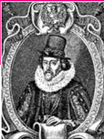
Lordo Francis BACON, Imperatoro de la Ordeno en la 17-a j.c.