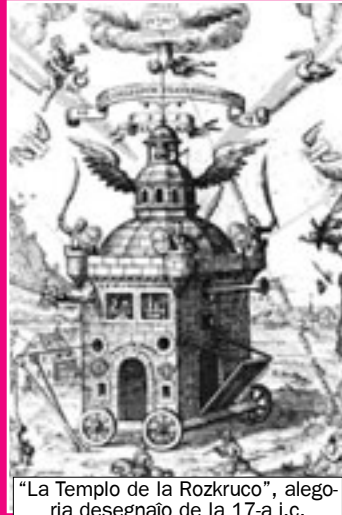
“La Templo de la Rozkruco”, alegoria desegnaĵo de la 17-a j.c.

Ordenon en Usono, kun sidejo en Novjorko, kun la oficiala nomo “Antikva kaj Mistika Ordeno de la Rozkruco” 5 .