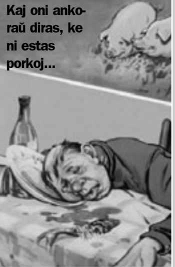
Kaj oni ankoraŭ diras, ke ni estas porkoj...

Kun la junaj bon-templanoj mi kun la vic-redaktoro konatiĝis dum la seminario pri projektmastrumado, komune organizita de TEJO kaj EGYTF* [egtif] – European Good Templar Youth Federation – Eŭropa Federacio de Junaj Bon-Templanoj. La seminario pasis bonege, kaj la sola plendeto de unu el la partoprenantoj TEJO-flanke estis pri la “malpermeso trinki bieron”. Nu, la plendeto estis evidente ŝerca, sed tamen neuzado de alkoholo estis kondiĉo de par-