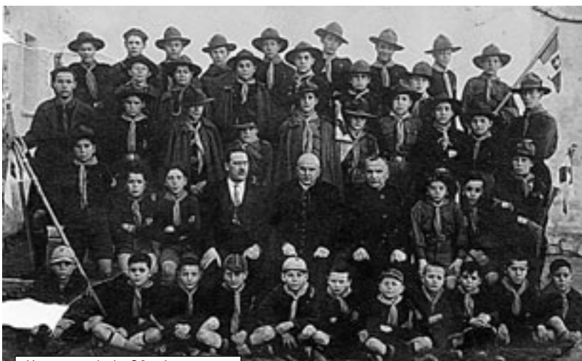
Komence de la 20-a jarcento...

Pli detale – ĉe http://ttt.esperanto.org/skolta ; la libro kun la kurso Ĵamborea Lingvo estas trovebla ĉe http://ttt.esperanto.org/skolta/jl