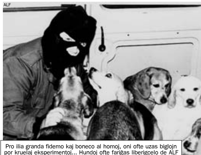
Pro ilia granda fidemo kaj boneco al homoj, oni ofte uzas biglojn por kruelaj eksperimentoj... Hundoj ofte fariĝas liberigcelo de ALF

* veganoj konsumas neniujn bestaĵojn – nek ovajojn nek laktajojn; ili ankaŭ ne portas felon, ledon ktp, kaj ne uzas produktojn de eksploatado aŭ kruela traktado de bestoj.