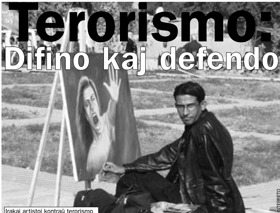
Irakaj artistoj kontraŭ terorismo