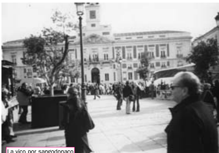
La vico por sangodonaco

Laŭ radio – la plej efika inform-medio en tiaj situacioj – estis entute dek bomboj en kvar trajnoj kaj pli ol cent mortintoj. Estis aliaj kvar