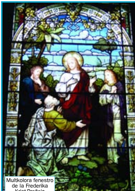
Multkolora fenestro de la Frederika Krist-Preĝejo