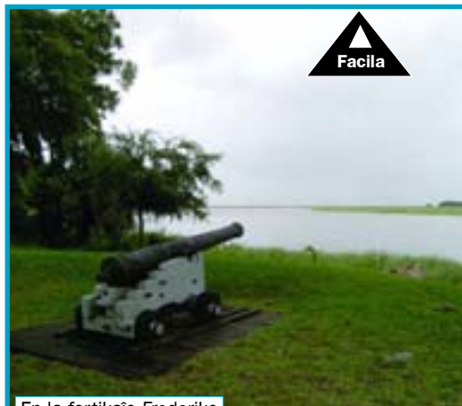
En la fortikaĵo Frederiko