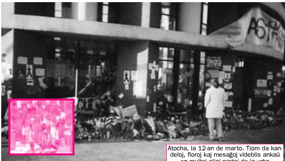
Atocha, la 12-an de marto. Tiom da kandeloj, floroj kaj mesaĝoj videblis ankaŭ en multaj aliaj partoj de la urbo

** Por esti tute preciza, tiu posteno nomiĝas “prezidanto de la registaro”, kio pli-malpli egalas al la posteno de ĉef-ministro en multaj landoj.