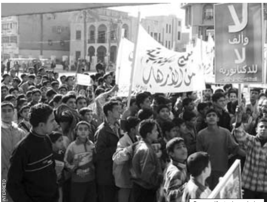
Pacmanifestacio en Irako