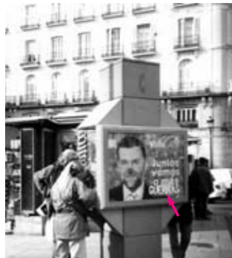
Publika telefono kun reklamilo de PP en Puerta del Sol. Al la frapfrazo "juntos vamos a más" ("kune ni iras plien") iu aldonis la vorton "guerras": "kune ni iras al pliaj militoj"

La unuajn bildojn pri la atakoj mi vidis en la metroa televido, ree en Madrido. Videblis multege da sango, homoj plorantaj, helpantaj aliajn homojn en ambulancoj... Tiuj ĉi estas bildoj, kiujn ni ĉiuj vidis iam en la televido dum diversaj katastrofoj kaj militoj en la mondo. Ĉi-foje tio estis por mi ne io abstrakta, sed plene kaj frape reala: la rompita kaj detruitaj trajnoj sur la ekranoj estis la ruĝ-blankaj "cercañas", kiujn