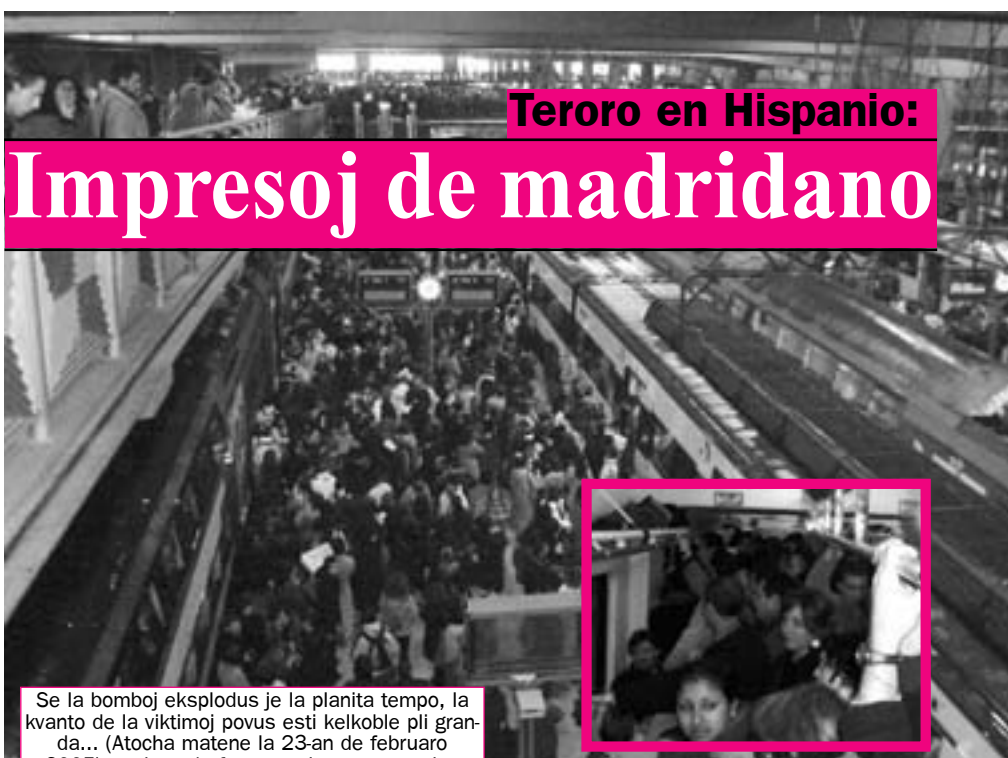
Se la bomboj eksplodis je la planita tempo, la kvanto de la viktimoj povus esti kelkoble pli granda... (Atocha matene la 23-an de februaro 2005); malgranda foto – en la matena trajno

La 14-an de marto de 2004 estis okazonta tutlanda balotado por la nova registaro. La politikaj preferoj de la hispanianoj dividiĝis plejparte inter la du ĉefaj partioj – dekstra (PP – Partido Popular , Popola Partio) kaj maldekstra (PSOE – Partido Socialista Obrero Español , Hispana Socialista Laborista Partio). Ili havis pli-malpli egalan politikan “pezon” laŭ la enketoj kaj ne estis klare, kiu venkos. La tria – komunisto partio – perdis pezon en la lastaj balotadoj, kaj oni kredis, ke la naciistaj partioj rompos la ekvilibron inter PP kaj PSOE kaj ludos decidan rolon en la elekto de la nova registaro. La naciismaj partioj estas popularaj