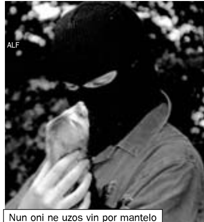
Nun oni ne uzos vin por mantelo

- Nu, iujn homojn niaj radikalaj agoj ja povas forpuŝi (aŭ almenaŭ ili povas esprimi sian malaprobos de niaj metodoj). Tamen ni kredas, ke tre ofte tiuj “moderaj” organizoj