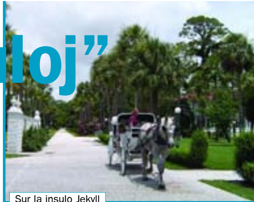
Sur la insulo Jekyll

altaro – plej sankta loko de preĝejo aŭ alia religia konstruaĵo fortikaĵo – bone protektita loko ( fortika – forta, malmola, malfacile rompebla) giganto – grandegulo girlando – longa plibeligaĵo, kiun oni uzas, ekz., por plibeligi kristnask-arbon indiano – ano de popolo, kiu vivis en Ameriko antaŭ veno de eŭropanoj kolonio – parto de lando, kiu troviĝas ekster ĝiaj originalaj limoj kverko – granda arbo, kiu tre longe vivas marĉo – akveca, lageca tero musko – kreskaĵo sen radikoj pastro – estro en preĝejo rara – malofta rezervejo – loko, kies naturo estas netuŝita sklavo – malliberulo sorĉi – efiki sur ion per supernaturaj fortoj sovaĝa – malhejma ŝuldanto – homo, kiu pruntis monon de alia(j) homo(j) kaj devas repagi turo – alta konstruaĵo