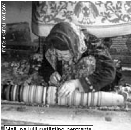
Maljuna lulil-metiistino pentrante

cirkumcidi – detranĉi parton de la prepucio (haŭta faldo ĉirkaŭ la penis-kapo), por lasi libera la peniskapon