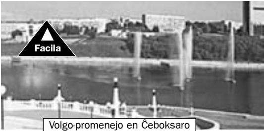
Volgo-promenejo en Ĉeboksaro