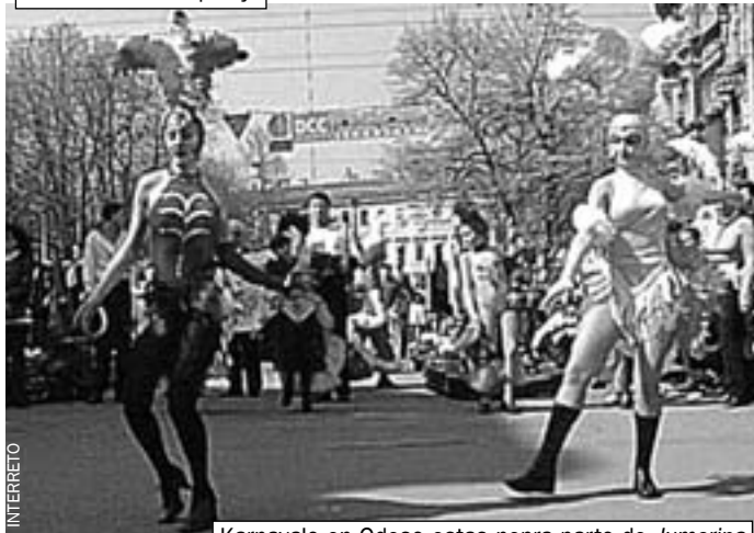
Karnavalo en Odeso estas nepra parto de Jumorina