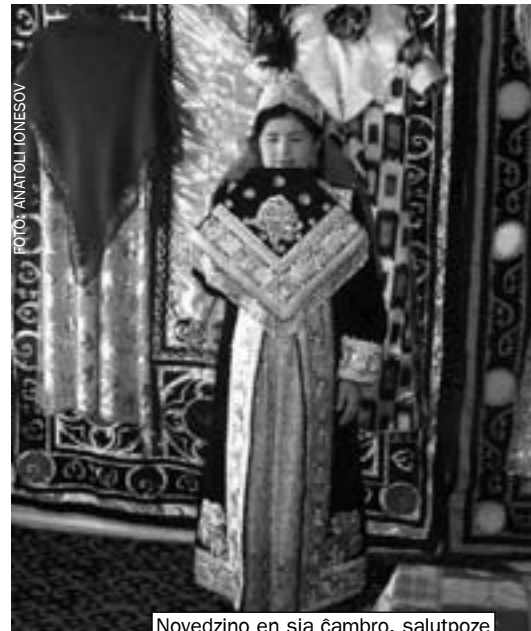
Novedzino en sia ĉambro, salutpoze

Post svatiĝo, en la tago de la geedziĝfesto, la flanko de fianĉo sendas siajn homojn al la domo de la fianĉino. La amikoj de la fianĉo kantas specialan kanton ĥore, aplaudas sur la strato kaj dancas. Ili faras tion laŭte por sciigi la najbarojn, ke fianĉino estas preta por edziniĝi. Post dancoj kaj kantoj oni invitas