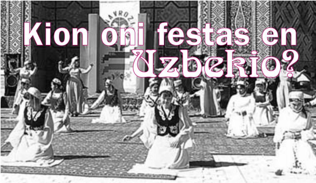
Navruz: unu el la plej ŝatataj popolaj festoj