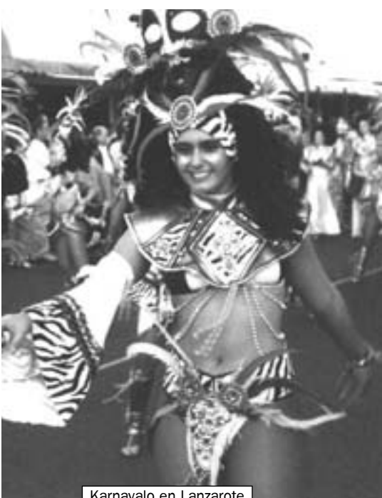
Karnavalo en Lanzarote

– Unu el la celoj de Eurasia Pedibus Calcantibus estas montri, ke nia planedo ankoraŭ apartenas al ni, ke ne estas limoj, escepte de la naturaj limoj. Mi ankaŭ volas montri, ke eblas trairi tiun ĉi mondon trans ĉiu trudita limo. Tial mi ekde la komenco esperis pri pozitivaj reagoj rilate la vizojn (kaj mi ankaŭ kontaktis eminentajn politikistojn kaj religiulojn por faciligi la aferon). Tamen,