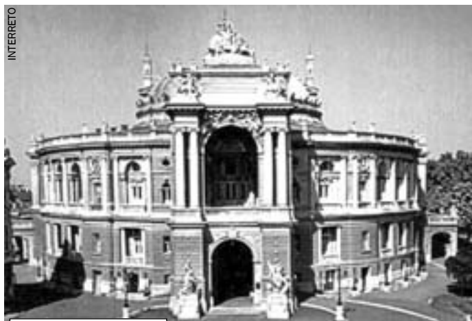
La fama Odesa Operejo

Certe, oni povus dece promeni en la urbo, ĝuante la belecon de ĝiaj arkitekturo kaj naturo; sed tio estus tamen iom ordinara kaj monotona, ĉu ne? Ege pli interesa kaj memorinda fariĝas la unua kontakto kun Odeso dum la Urboludo. Nur du horoj sufiĉas por kalkuli (per siaj propraj kruroj!) ĉiujn 192 ŝtupojn de la Potjomkin-ŝtuparo, trovi la bustojn de eminentuloj sur la fasado de l' Operejo, viziti la domon kun vitra tegmento, miregi antaŭ la unumura domo, omaĝi D-ron ZAMENHOF apud lia monumento kaj konatiĝi kun aliaj, ne malpli interesaj vidindaĵoj de Odeso. Esti en Odeso kaj ne viziti la Operejon estas nepardonebla fuŝo, kiun oni ne povas al si permesi. La Operejo, fiero de ĉiuj