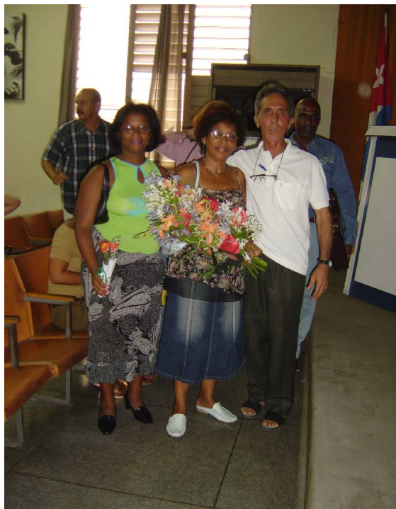
Kelkaj el la fondintoj de la Esperanto-movado en Santiago