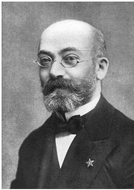
Lazar Ludwik Zamenhof (1859-1917, autor Esperanta 1887.)

Temeljni rječnik jezika jest P.I.V. ( P lena i lustrita v ortaro = Potpuni ilustrirani rječnik). To je jednojezični esperantsko-esperantski rječnik. Značenje pojedine riječi je opisano drugim riječima na esperantu. Pokazani su i bitni primjeri upotrebe svake riječi. PIV je neophodan svakom prevoditelju i svakome tko se želi usavršiti u jeziku. Veći broj pojmova objašnjen je ilustracijama. Najnovije izdanje PIV-a izašlo je iz tiska 2002.